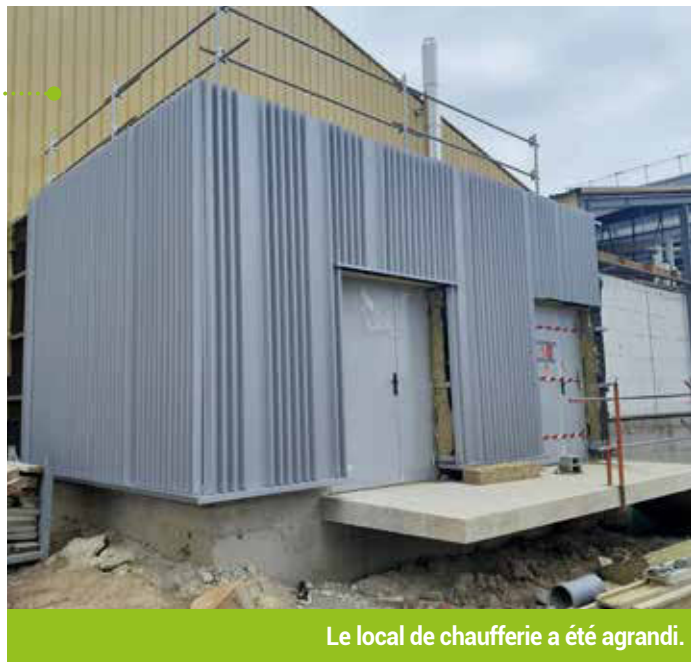
Le local de chaufferie a été agrandi.

La première phase des travaux du projet de la Cressonnière a été réceptionnée fin juin 2026. Cette étape marque l'avancée de la transformation du site en éco-complexe sportif et culturel. Les travaux ont notamment porté sur la rénovation thermique de la salle de sport, avec une amélioration de l'isolation et des performances énergétiques de cette partie du bâtiment. Les locaux de stockage et la chaufferie ont également été agrandis afin d'anticiper les futurs besoins du complexe. La Ville poursuit la préparation des prochaines phases du projet pour proposer un équipement plus durable, fonctionnel et ouvert à tous.