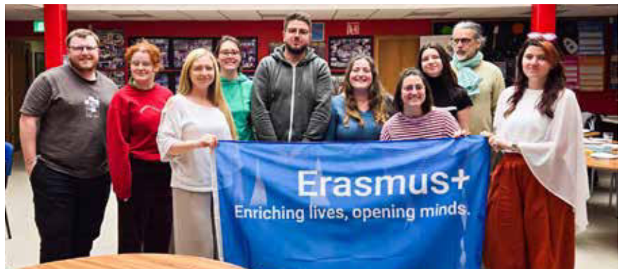
Rencontre partenariale en Irlande.